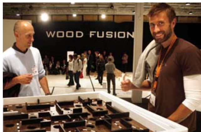
Wood Fusion är en kreativ mötesplats för designers och arkitekter.