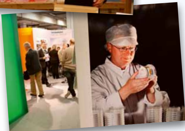
Från Emballators monter.