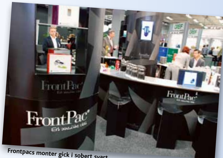
Frontpacs monter gick i sobert svart.