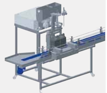
KOMPAKTFYLLARE – LINJE