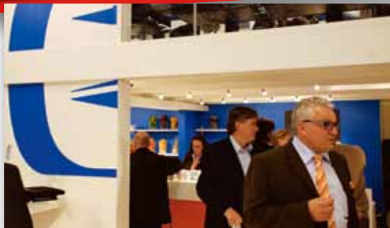
Smurfit Kappa – ett av de större monterbyggena.