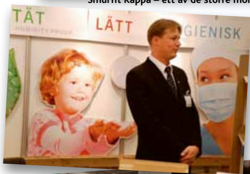
Estländska kartongproducenten Röpina bjöd på mjuka värden.

I dag avslutas Scanpack 2009, och Mäsextra bjuder på ett litet collage av bilder fångade bland monterarna i Göteborg.