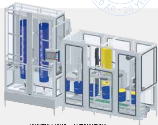
HINKFYLLNING – AUTOMATISK