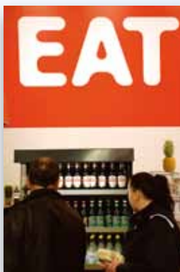
Magen måste ha sitt den också.