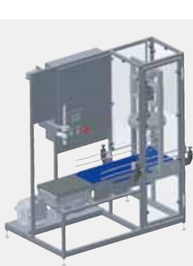
HINKFYLLNING – ENKEL